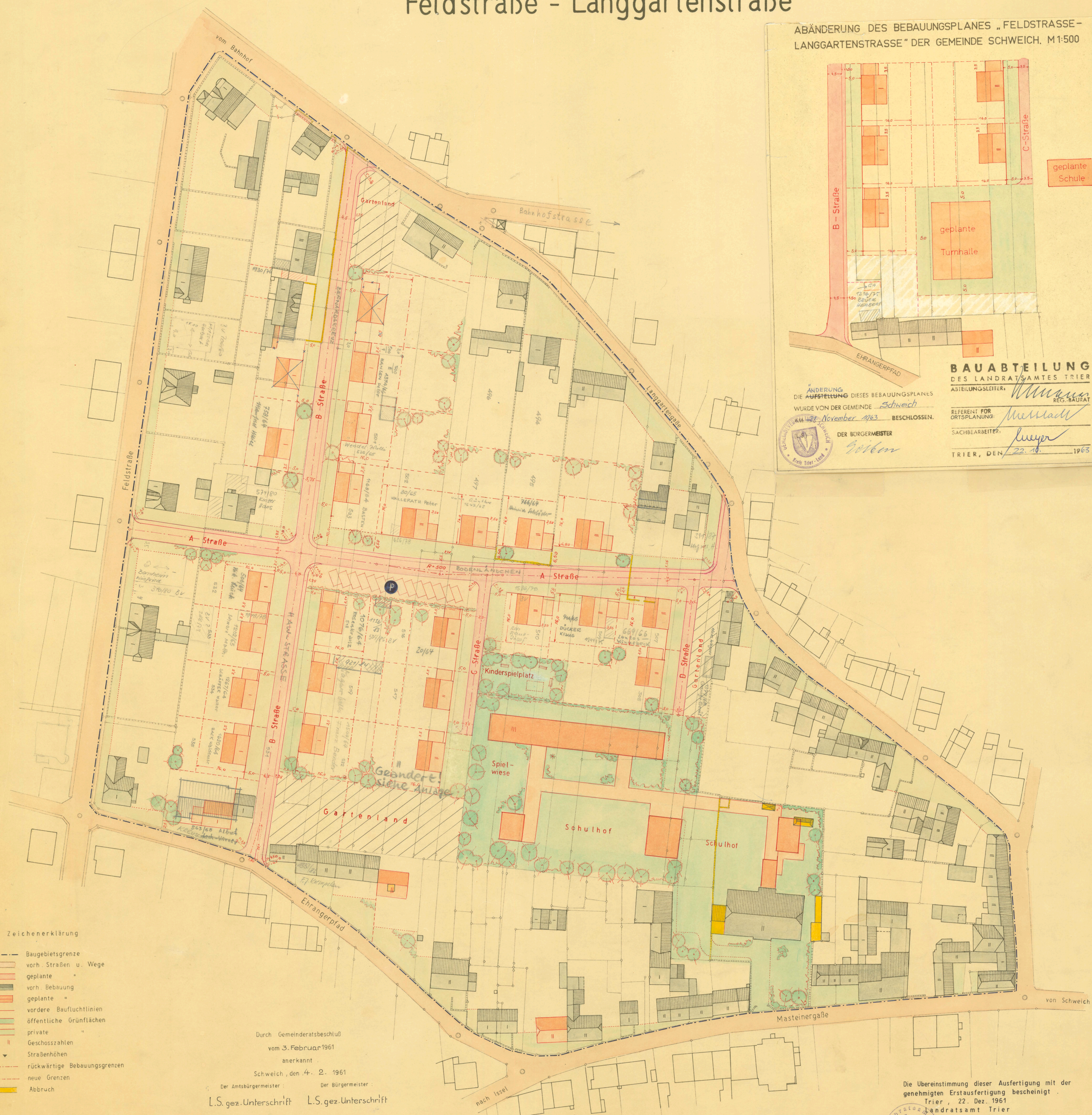
ABÄNDERUNG DES BEBAUUNGSPLANES „FELDSTRASSE - LANGGARTENSTRASSE“ DER GEMEINDE SCHWEICH, M1:500